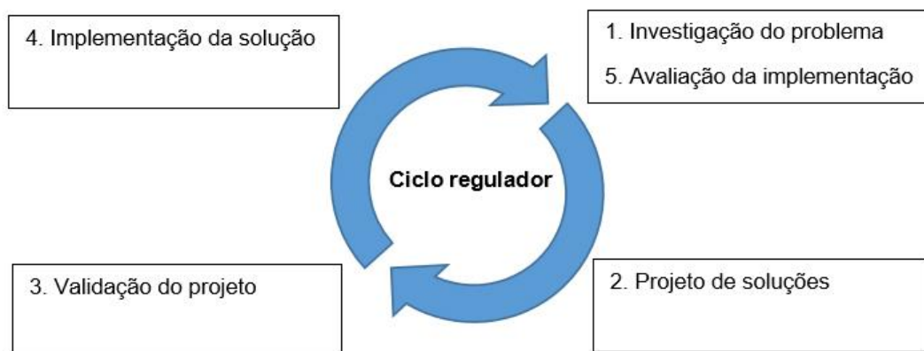
Figura 1 - Ciclo regulador de Wieringa